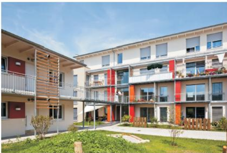
Innenhof mit A- und C-Flügel

Wir wollen dem Trend der Vereinzelung der Menschen und der Entfremdung der Generationen entgegenwirken. Es soll eine Generationen verbindende Gemeinschaft heranwachsen können, in der Menschen in unterschiedlichen Lebenslagen aktiv und selbstbestimmt wohnen. Wir wollen individuell in einer Nachbarschaft leben, wo gegenseitige Hilfe und Unterstützung zur Selbstverständlichkeit wird.