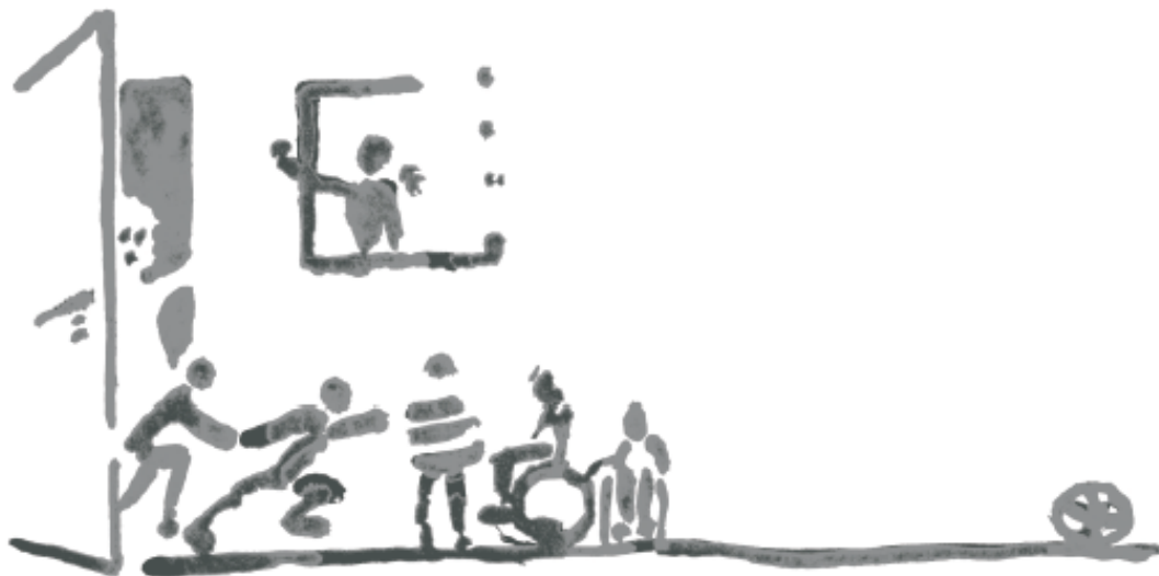
Zeichnung: Christel Frank

Ein Passivhaus ist mit einer überdurchschnittlichen Wärmedämmung isoliert. Die Fenster und Türen sind 3-fach verglast. Ein Lüftungssystem kontrolliert die Zu- und Abluft. Bei Bedarf wird die zugeführte Luft aufgeheizt. Der Heizölbedarf liegt bei nur 1,5 l pro Quadratmeter und Jahr. Durch das Lüftungssystem entsteht ein gleichmäßig temperiertes Raumklima - für Allergiker bestens geeignet. Das Passivhaus ist absolut schimmelfrei.