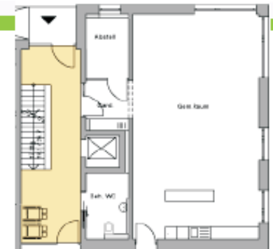
Großer Gemeinschaftsraum im Erdgeschoss