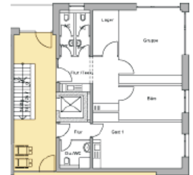
kleiner Gemeinschaftsraum und Gästeapartment 1 im 1. Obergeschoss